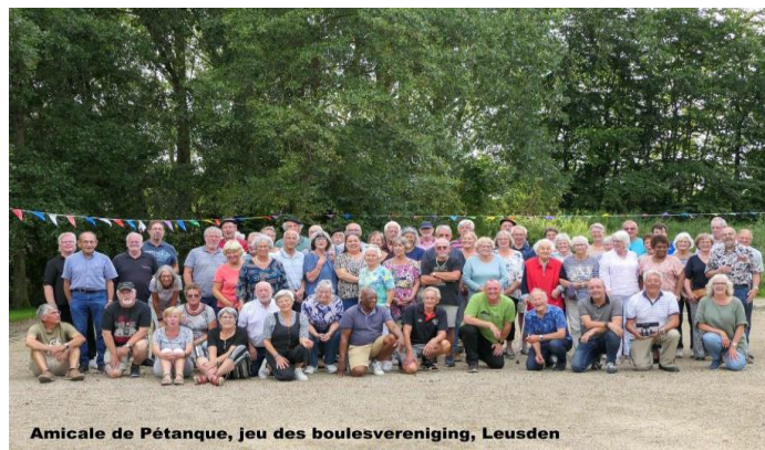
Amicale de Pétanque, jeu des boulesvereniging, Leusden