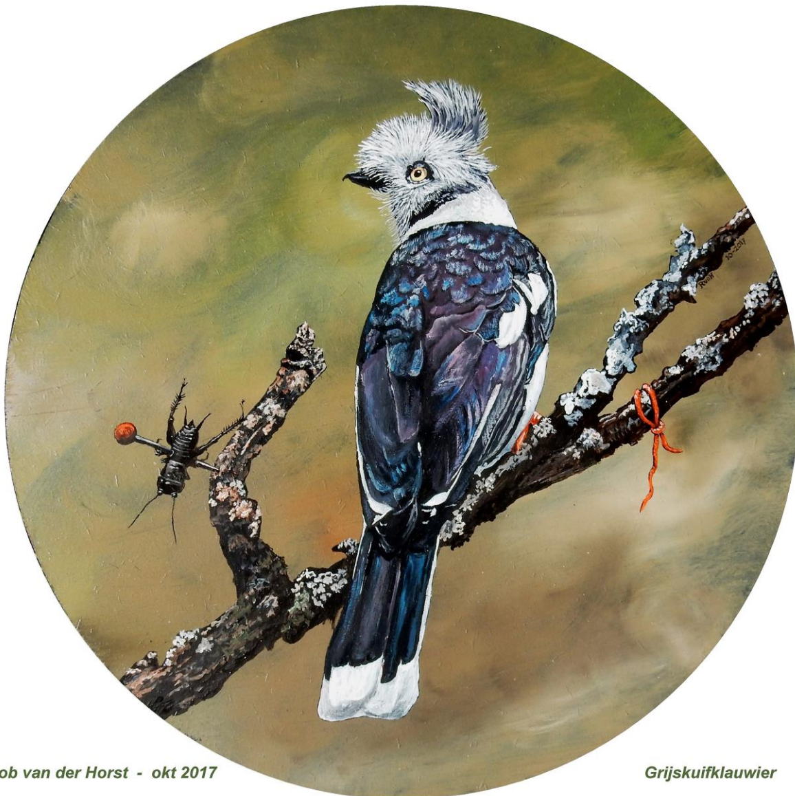
Rob van der Horst - okt 2017

De reuzentoerako bezoekt meestal het bladerdak in hoge bomen van het bos. Hij voedt zich voornamelijk met fruit maar ook met knoppen, scheuten, bladeren, bloemen en sommige insecten. De kuikens worden gevoed met uitgebraakte bladeren. De reuzentoerako is zeer wendbaar en beweegt snel in de bomen. Het zijn schuwe vogels en ze komen zelden op de grond, behalve om te baden en te drinken.