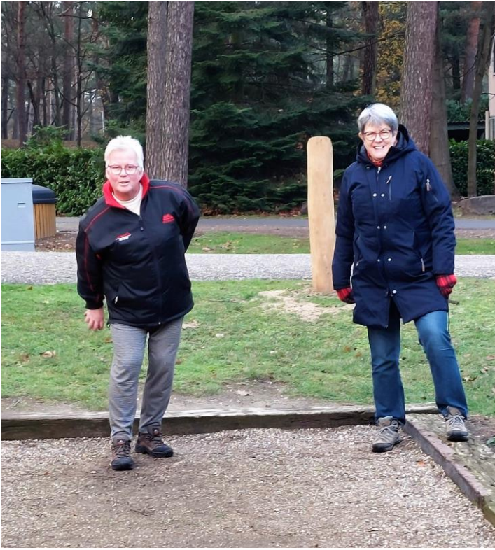
Amicalers in training voor het Sinteurotoernooi